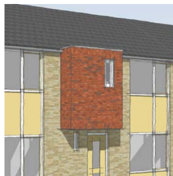
ELASTOLITH steenstrips i.c.m. FERNACELL H 2 O- paneel