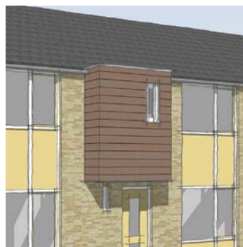
PLATOWOOD, geplatoniseerd duurzaam hout