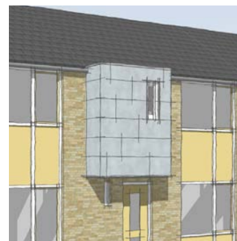
KALZIP, FC-gevelsysteem, aluminium gevelbeplating