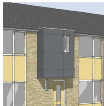
TRESPA Meteor, duurzame gevelbeplating